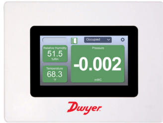
带有标准塑料边框的 RSME